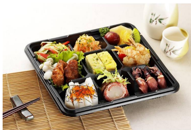
塑膠需以組為單位購買