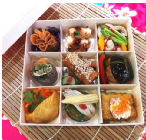
木板九宮格 240 x 240 x 50 (mm) $45