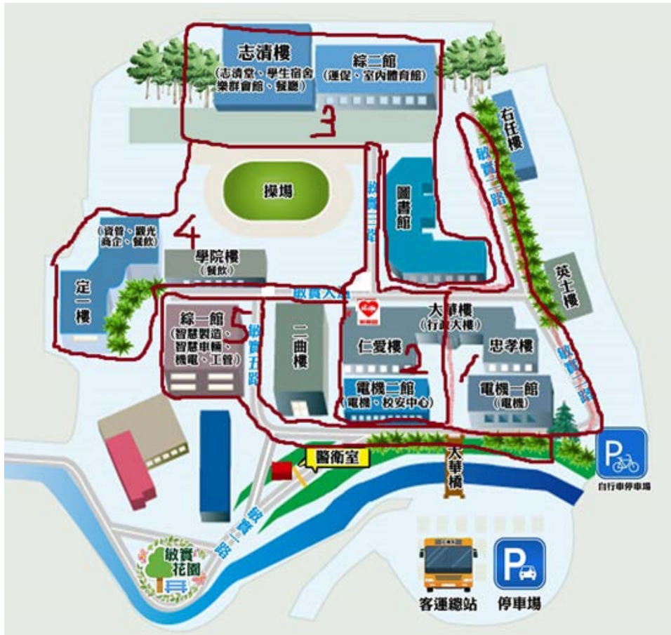
清潔人員校區工作分區圖